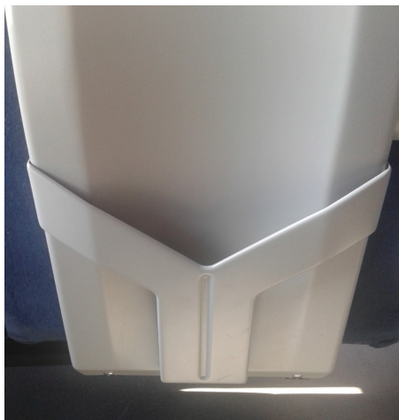
Sampling - ulotki przy siedzeniach pasażerów, format A4