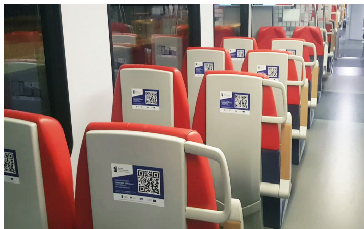
Naklejka na oparciu fotela, maks format A5.